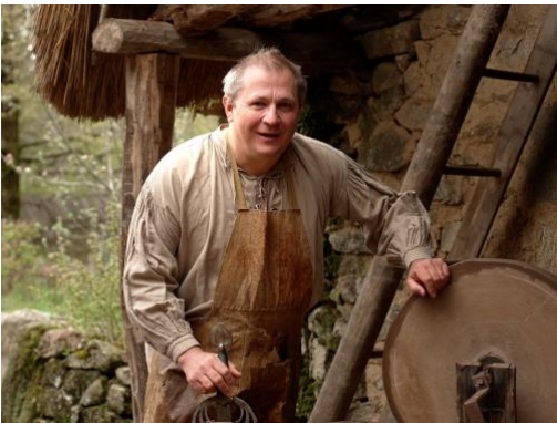
Le forgeron, dans son atelier.