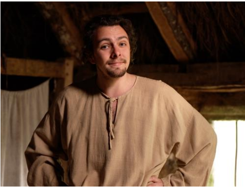
Le meunier, dans son moulin.