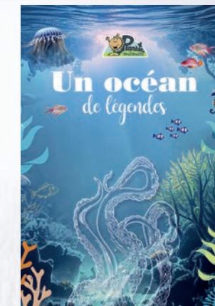
Un océan de légendes