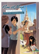
La diversité des langues