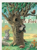
La forêt et les contes