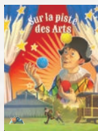
Les arts et les couleurs