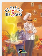
Les 5 sens et les aliments