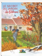
Le jardin et les saisons